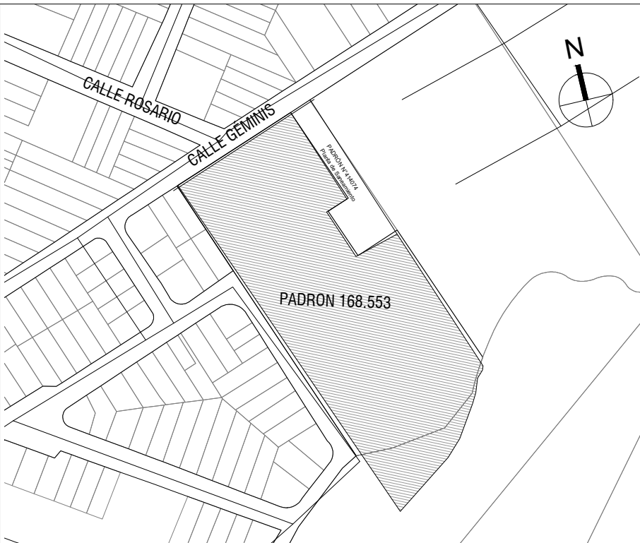
PLANO DE UBICACIÓN escala 1/4000

Notas La modificación de alineaciones se encuentran en proceso de aprobación. La solicitud fue gestionada por la Ing. Agrim. Verónica Dos Santos en EXP: 2022-4142-98-000114.